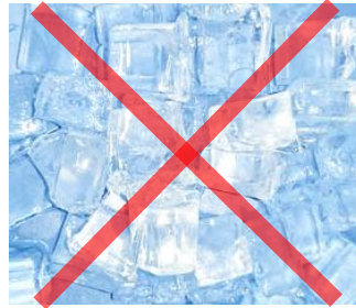
ハーフキューブアイス