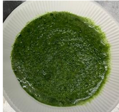
従来品の仕上がり