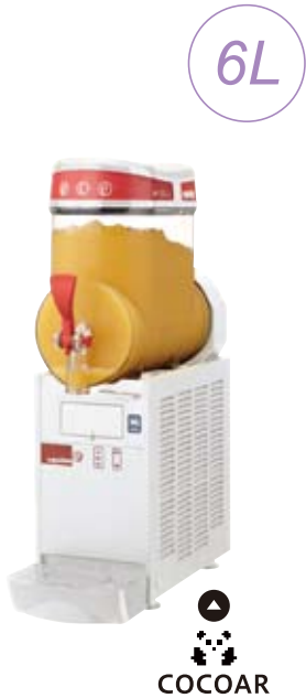
mini-1 ¥ 220,000 (税別)

簡単レシピで美味しいフロースドリンク&カクテルが作れます スイッチ切替で、ドリンクディスペンサーとしてもお使い頂けます。コンパクトな6Lタイプとレギュラー10Lタイプをご用意しました。