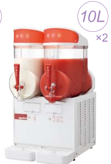
MT-2 ¥ 450,000 (税別)