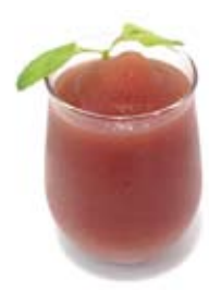
サングリアフロース