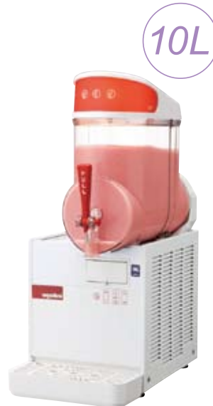
MT-1 ¥ 350,000 (税別)