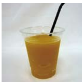
マンゴーフロース