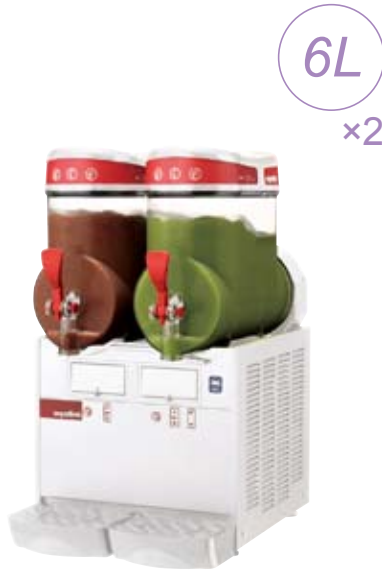
mini-2 ¥ 330,000 (税別)